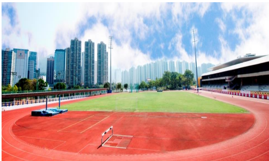
(香港體育學院田徑場)

本課程以六個月兼讀制形式修讀，分為平日晚間班或週末日間班，在沙田香港體育學院上課。有意申請者，可瀏覽體院教練培訓部網站 www.hkcoaching.com 查詢上課時間表。