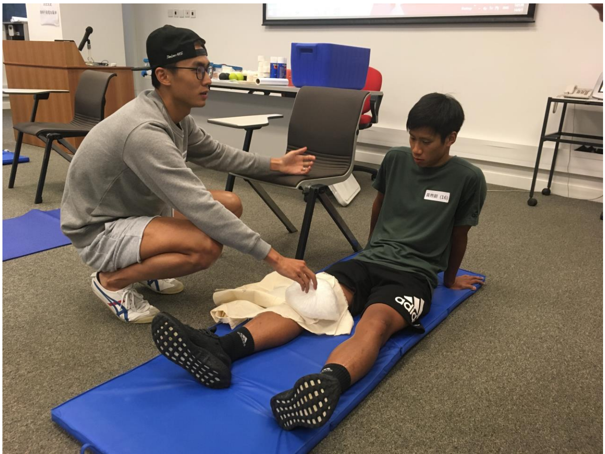
處理運動創傷的課堂