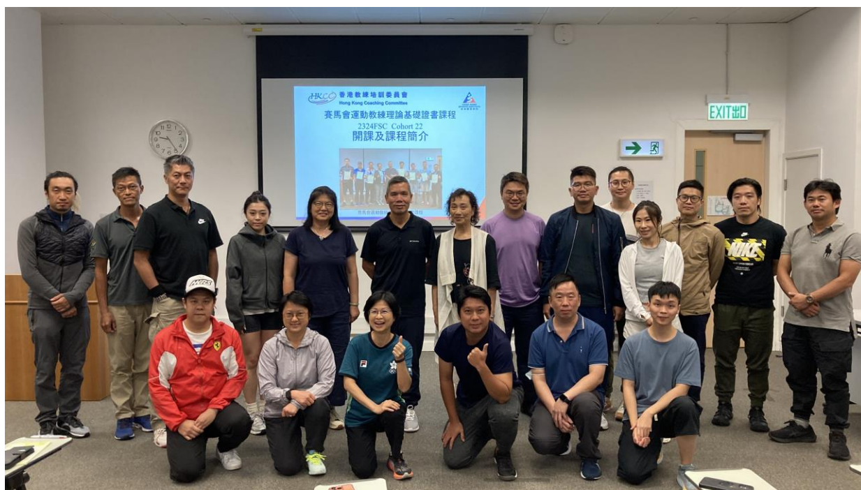
開課及課程簡介會

體院教練培訓部會根據學員的正式學歷及 / 或相關經驗審批豁免。在任何情況下，單元豁免的數目不得超過單元總數的百分之五十。